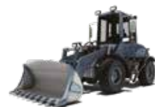
PALA GOMMATA COMPATTA